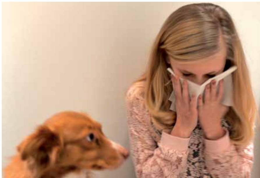
Allergi hos barn och unga ökar kraftigt. Nästan var femte barn är pollen- eller pälsdjursallergiker och allt fler familjer förvägras möjligheten att ha hund.

Hans. Genom att introducera den i en viss typ av bakterie, får man den att börja producera allergenet. Och efter att man renat bort alla de proteiner som bakterien normalt producerar, har man bara den aktiva substansen kvar.